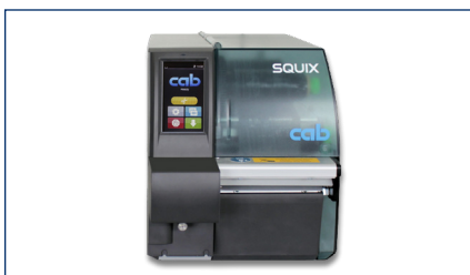
CAB Squix Ticketdrucker